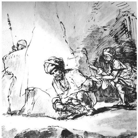
Saul en David in de grot Rembrandt van Rijn - 1657