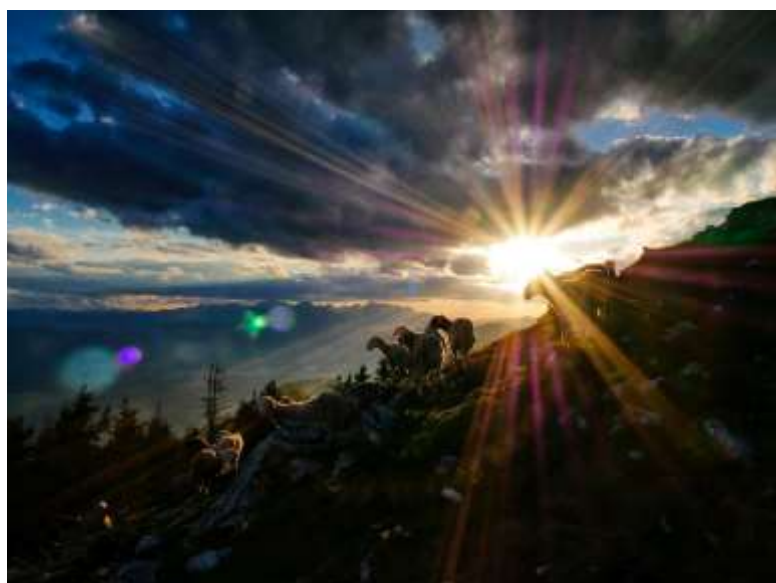
Hoed mijn schapen

Voor de tweede keer klinkt diezelfde, indringende vraag: 'Simon, zoon van Johannes, heb je mij lief?' Opnieuw is er geen onvertogen woord, geen beschuldigende vinger over wat er gebeurd is, maar een vraag over de relatie, de liefde voor elkaar. Misschien