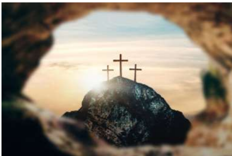
De gekruisigde leeft

In die onwrikbare, sterke rots zijn diepe barsten en groeven geslepen. Scheuren van twijfel en angst. Toen het erop aankwam had hij ontkend. Op de vraag of hij bij hem hoorde, had hij geantwoord: ‘ik ken hem niet’. Tot drie keer toe zelfs. Bij de derde