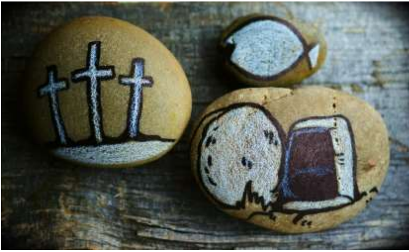
Jezus als hoeksteen van het huis