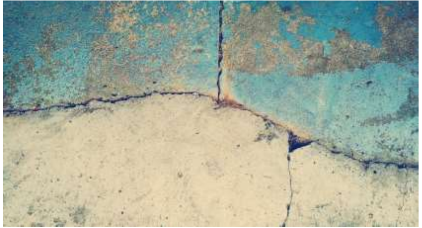
Dikke muren worden uiteen getrokken

Tegenover de haat van de wereld staat de vrede waarmee Jezus mensen opnieuw met elkaar verbindt: "want hij is onze vrede, hij die met zijn dood de twee werelden één heeft gemaakt, de muur van vijand-