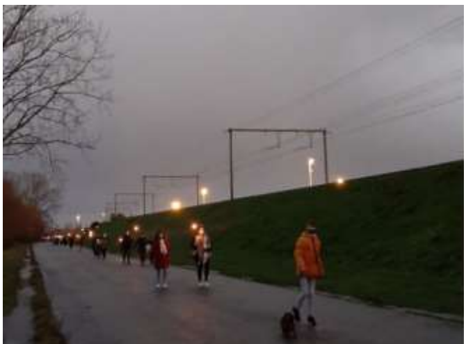
Stille dragers van licht