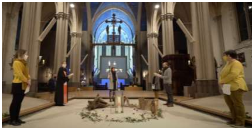
Het ontvangstmoment in Brugge