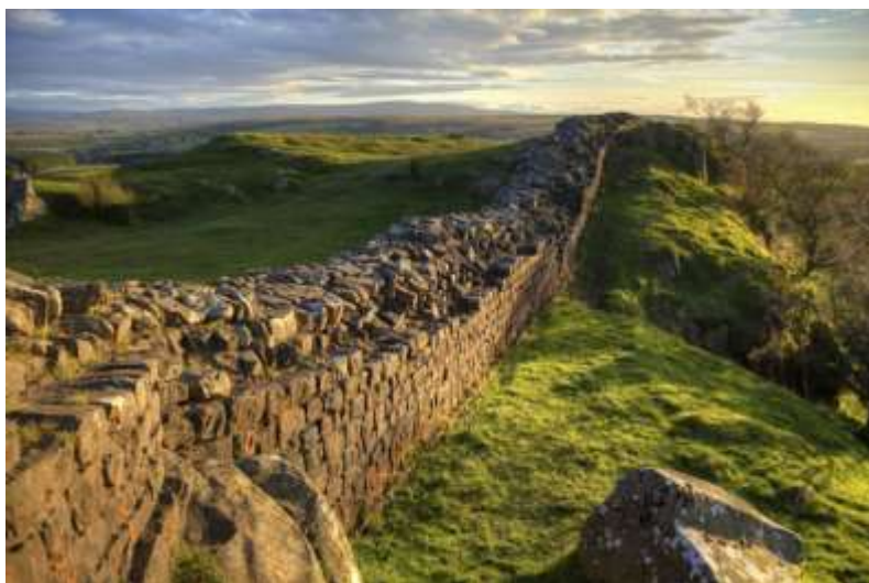
De muur van Hadrianus