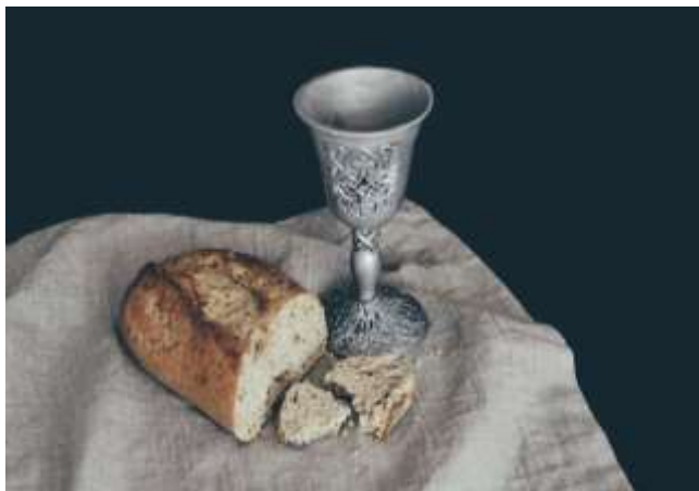
Neem en eet hiervan

ogenblik, bij het zien van het gebroken brood, en het horen van de woorden – ‘neem en eet hiervan’ gaan hun harten open. Het is Jezus zelf die bij hen aanligt. Hij is niet dood. Hij is de Verrezenen die zelf het brood met hen deelt. Maar op dat ogenblik van herkenning, wordt hij onttrokken aan hun blik. De Opgestane Heer laat zich niet vasthouden.