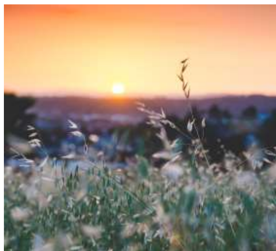
De dag loopt ten einde

Vanaf vers 28 krijgt het verhaal een nieuwe wending. Het is al avond geworden en de zon is ondergegaan. Kleopas en zijn vriend willen deze vreemdeling bij hen houden. Er is iets tot beweging gekomen in hen, en ze ‘dringen aan’: ‘Blijf bij ons, want het is al bijna avond en de dag loopt ten einde’ (Lc 24:29). Jezus doet wat ze vragen: hij gaat met ze mee het dorp in en blijft bij hen. Dat