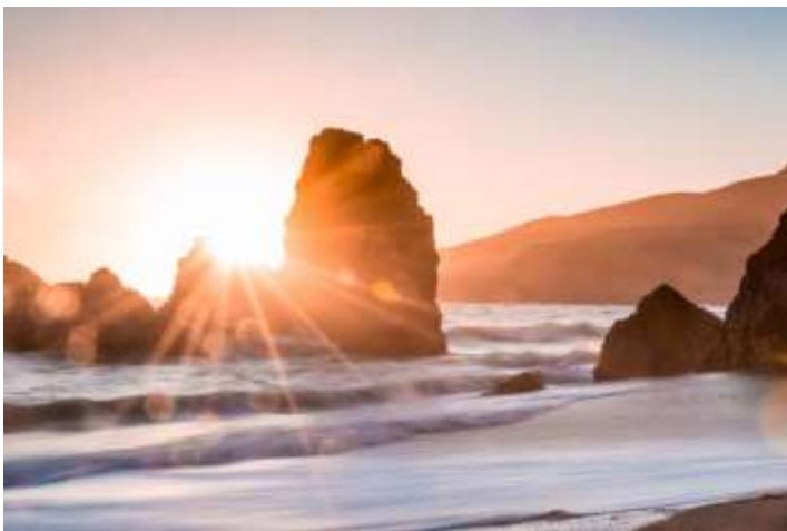
God is licht

Psalm 27 is een mooi lied om te lezen in de lijdenstijd. Vertrouwen in God, benauwing door vijanden en hoop op Gods bevrijding roepen elkaar steeds weer op, als bewegingen die in- en uitvloeien. Geborgenheid, weten dat je bij God veilig bent... en dan weer de benauwing, vertrouwen dat omslaat in angst, zorgen die verlammen... en dan toch weer de hoop die door alle vragen en twijfels heen zich opdringt: de belofte dat God eens zal bevrijden: het klinkt allemaal mee in dit indringende lied. In deze overdenking neem ik u mee naar Psalm 27: een lied dat oproept tot bezinning en gebed: hoe gaan wij om met vijanden en leed dat ons benauwt? Waar zoeken wij dan onze hulp?