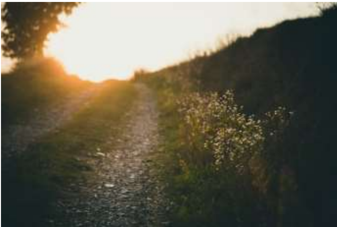
Wijs mij uw weg

Vanaf vers 7 is er nog weinig te merken van die geborgenheid. Vertrouwen is omgeslagen in benauwing en David roept en schreeuwt om hulp: 'Hoor mij, HEER, als ik tot u roep, wees genadig en antwoord mij'. Gevoelens van eenzaamheid en verlatenheid dringen zich op. Overlegend met God, zegt hij in zijn hart: 'zoek ( bāqaš ) zijn aangezicht'. David stemt in met wat zijn hart hem ingeeft. Ook in de benauwing zoekt hij God. En dan klinken in vers 9 indringende smeekbeden. Opnieuw valt ook nu het werkwoord 'verbergen' ( sātar ). Maar nu heeft het niet de betekenis van geborgenheid of veiligheid, maar van afwending. David roept het uit: dat God zijn aangezicht niet verbergt en hem niet verlaat (vgl. Ps. 13:2). En toch komt David ook hier tot een krachtig belijden: al hebben mijn vader en moeder mij verlaten, en is er niemand die mij nog ziet, toch zal de Heer mij verzamelen met de zijnen.