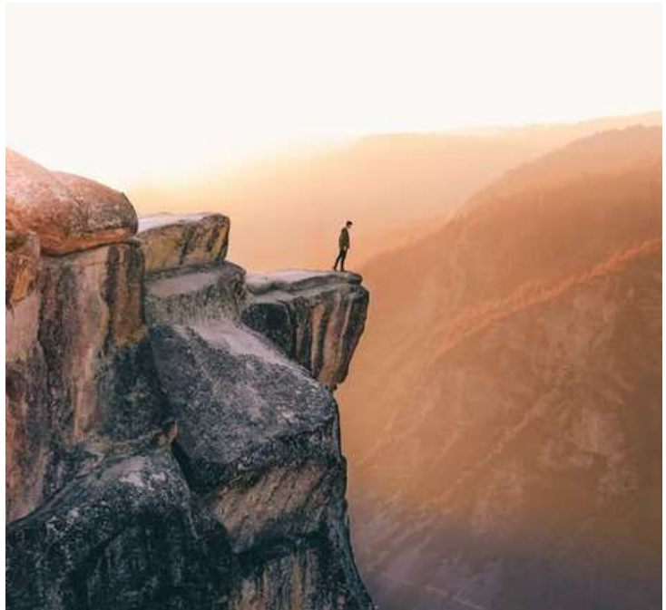
Hoog op een rots

Maar David is nog ver verwijderd van de tempel en vindt beschutting in zijn loofhut tegen de wind en de regen (vgl. Ps 31:20-21); in zijn tent ervaart hij hoe God hem verbergt ( sātar ). De ervaring van veiligheid en geborgenheid roept jubel bij hem op. David zingt hoe God hem op een rots heft, hoe hij zijn hoofd verhoogt boven zijn vijanden (cf. Ps 18:47). Hij betaalt zijn dank