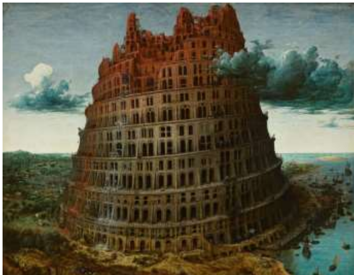
De toren van Babel door Pieter Bruegel, 1563

die haar uitdrukking vindt in het blijven op één plek en het hebben van één naam. In vers 3-4 komt er vier keer een aansporing terug. Letterlijk staat er: