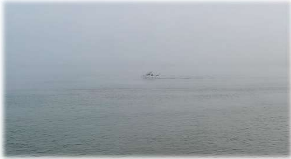
Mistige zaterdagmorgen in Oostende

Het licht is sterker dan het donker en het daglicht overwint de nacht,