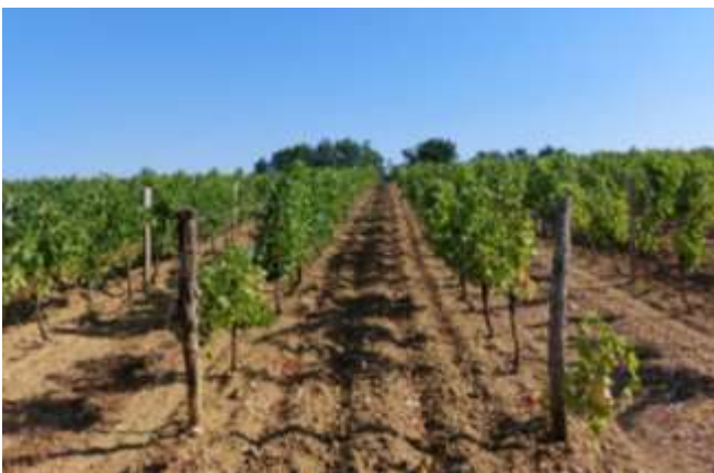
Wijngaard bij Lavardac

Een paar jaar geleden bezocht ik tijdens mijn vakantie een wijngaard in de buurt van Lavardac, in het gebied Lot-et-Garonne. De wijnboer vertelde ons over al het snoeiwerk dat gebeuren moet. Hij gebaarde trots naar de grote druiventrossen: ‘wie goede vruchten wil, moet op tijd snoeien’. Oktober is de tijd van het oogsten. Daarna volgt de wintersnoei: de twijgen worden weggehaald en de takken worden afgeknipt tot ze 5-7 cm zijn. De knoppen die nog aanwezig zijn in de verdikkingen van de takken, zullen in mei weer uitlopen. De boer vertelde dat de zomersnoei niet lang meer op zich laat wachten. In augustus worden de lange