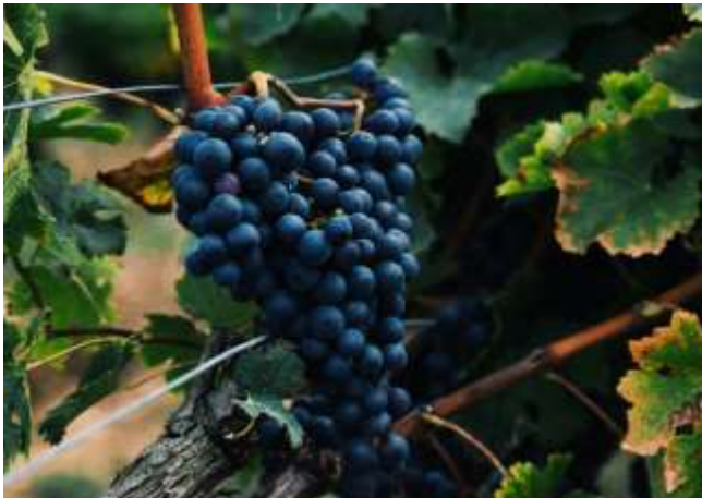
Volle ranken

Het is een mooi, maar ook confronterend beeld: wie zich op andere zaken richt dan de bron van het leven, zal weinig succes ervaren. Zoals de wijnranken uit zichzelf geen vrucht kunnen dragen, zo zal ook onze dienstbaarheid voort moeten komen uit Christus. Al onze inzet zal gevoed moeten worden door de liefde van Christus. Alleen dan zal er blijvende vrucht zijn. ‘Zonder mij kun je niets doen’ (Joh 15:5). Wie de liefde van Christus heeft ervaren weet dat alles genade is, en dat wij uit eigen kracht niet de vruchten kunnen voortbrengen van Gods koninkrijk. Dat maakt een mens nederig en mild, gunnend ook ten opzichte van anderen.