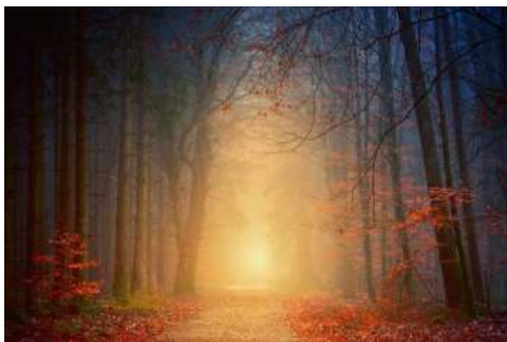
Een doorgang van licht

heerlijkheid. Paulus gebruikt in vers 1 het beeld van het ‘aardse tenthuis’, dat hier niet alleen verwijst naar het lichaam, maar naar het hele breekbare en vergankelijke bestaan. Zoals een tent niet tegen storm en regen bestand is, zo kan ook de aardse existentie in één enkel ogenblik weggevaagd worden. Het leven op aarde staat voor Paulus in contrast met een bestaansvorm die hij vergelijkt met een ‘gebouw’ van God. Dit gebouw is ‘in de hemelen’ en is niet door mensenhanden gemaakt; het is een ‘eeuwig huis’. Deze nieuwe en hemelse bestaansvorm ontvangt de mens uit Gods handen. Het is de plaats waar wij overstraald worden met Gods lichtglans en glorie.