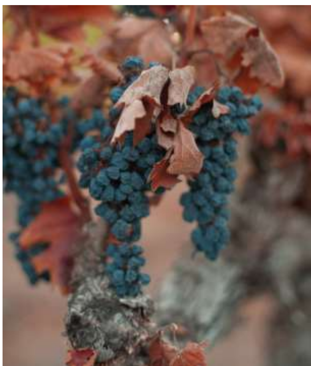
Verdroogde druiven

van Micha, waarmee het boek afgesloten wordt: een gebed dat begint met een felle profetische aanklacht, maar eindigt in een heilsvisieën, een boodschap van hoop en bevrijding.