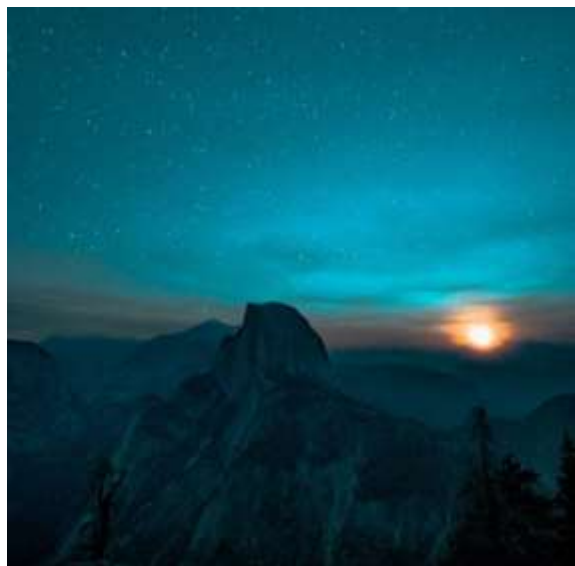
Als het licht daagt

Het gebed van Micha eindigt in vv. 18-20 met Gods bevrijdende hand. In de vraag 'wie is een God als U' ( mī'ēl kāmōkā ) klinkt niet alleen Gods redding door, maar ook de betekenis van Micha's naam. Want Micha betekent: 'een God als Hij'. De Enige is een God van liefde en genade. Alleen Hij is zo barmhartig dat Hij zich ook nu over mensen ontfermt en schulden vergeeft. Het kwaad dat mensen deden zal Hij in de diepte van de zee werpen. Zo ver als het oosten is van het westen, zo ver zal de zonde van ons verwijderd zijn (cf. Ps 103:12). Zo schenkt God ons een nieuw begin.