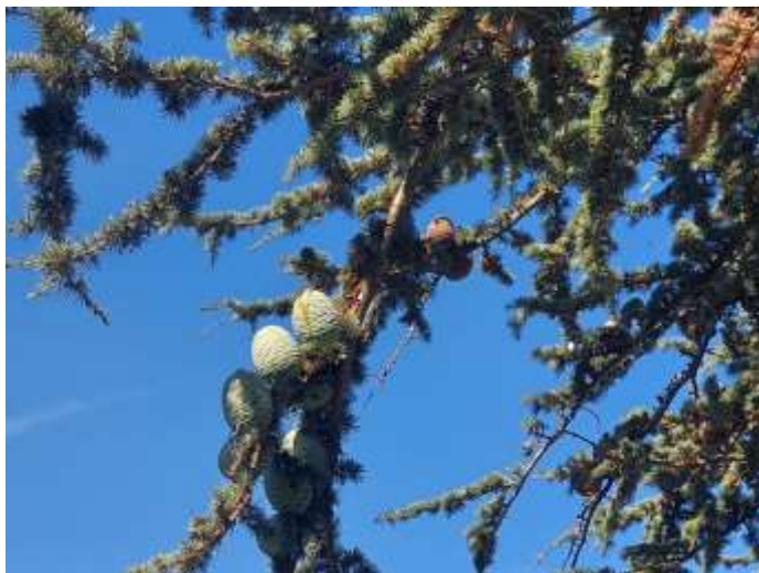
Libanonceder in de kasteeltuon van Amboise

In vers 13 begint het derde en laatste tekstgedeelte. Niet langer gaat het over de wettelozen, maar over de rechtvaardigen. Voor de tweede keer gebruikt de dichter het werkwoord 'bloeien' ( pārah ). Het onkruid groeit snel, maar God zet daar wel iets tegenover. Ook de rechtvaardigen groeien. Zij zijn als palmen. In tegenstelling tot het onkruid groeien ze langzaam omdat hun wortels eerst diep in de aarde moeten reiken. Palmkwekers zullen vaak een zak over de kruin van de boom trekken, of zelfs een steen op z'n top leggen, zodat de jonge palm eerst naar beneden zal groeien en daarna pas in de hoogte. In het tweede deel van vers 13 wordt ook de Libanonceder genoemd: ceders zijn imposante bomen met majestueuze brede takken. Je komt soms nog Libanonceders tegen in Engelse tuinen. Zo ook in de tuin van het koninklijk kasteel in Amboise. Achter het kasteel, staat een stokoude Libanonceder die geplant werd in 1840. De oude boom blijft fris en groen en draagt veel vrucht. Haar kegels druipen van het hars, en haar brede groene takken geven verkoeling tijdens warme zomerdagen.