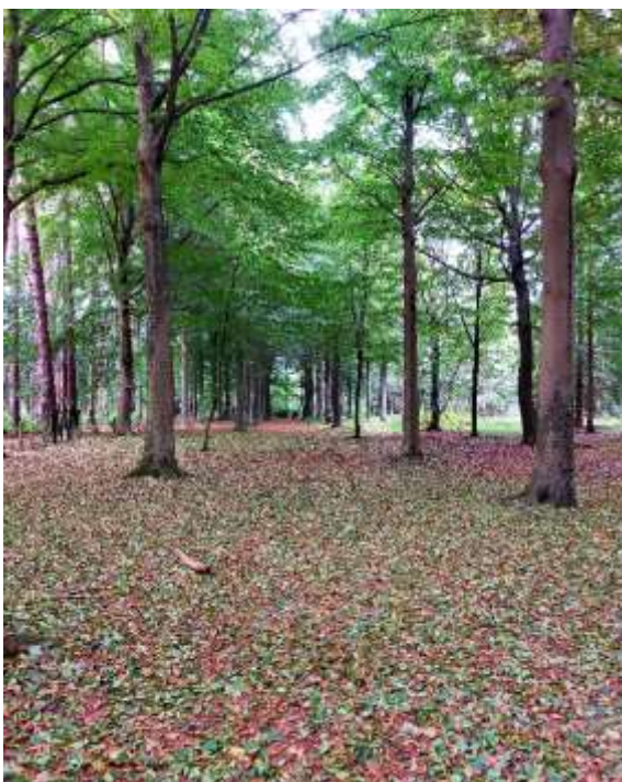
Groene bladeren vallen af...

'Goed is het de Heer te loven'. Na het opschrift, is tôb het eerste woord dat klinkt. Psalm 92 begint met een uitnodiging om de Heer te loven en zijn Naam te bezingen. Door de week zijn we druk in de weer met van alles en nog wat. Maar op de zevende dag worden we uitgenodigd om stil te staan bij het maaksel van Gods handen, alles wat goed is in deze wereld. Want op de zevende dag rustte God. Wanneer Hij op de zesde dag kijkt naar al zijn scheppingswerk en ziet dat het 'zeer goed' is, valt met het ondergaan van de zon de rust in (Gen 1:31; 2:2-3). Wat ook opvallend is: in vers 3 spreekt Psalm 92 niet over één nacht, maar over 'nachten'. De rust en de vreugde van de zevende dag mag je meenemen in de week die volgt. Elke morgen mag je ontwaken met de belofte dat Gods liefde je begroet met het eerste morgenlicht. Zelfs in de nachten, wanneer je uitrusten mag van al je arbeid, mag je denken aan Gods trouw.