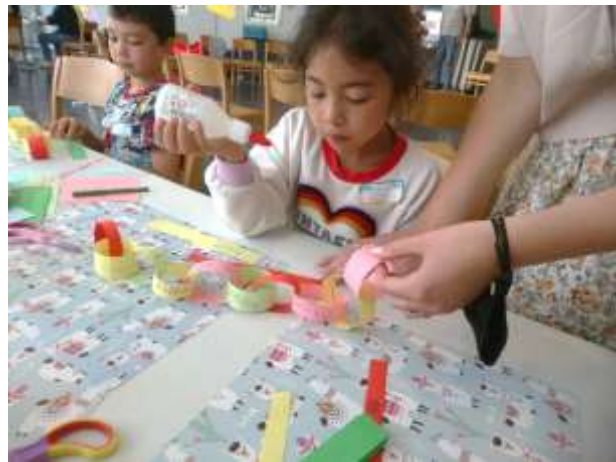
Hier wordt gewerkt aan een gebedsslinger

Bijbelgroep Jozef – in september herstarten we met de Bijbelgroep Jozef – we lezen en bespreken met een oecumenische groep christenen de Bijbelverhalen over Jozef uit het Bijbelboek Genesis. De Bijbelgroep komt de tweede woensdag van de maand samen in de Hazegraskerk vanaf 19:00 uur. De eerste keer op 8 september.