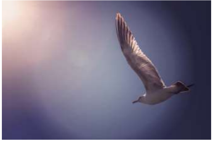
Kijk omhoog!

lijkt los te komen van haar grondvesten, verweerd en opgebruikt zoals een versleten kleding... wij zien vandaag wat de profeet ziet. Ramp op ramp werd deze zomer gemeld: de overstromingen die ook ons land troffen; huizen bedolven onder modderstromen en mensen die wegzonken in de diepte van het water dat maar