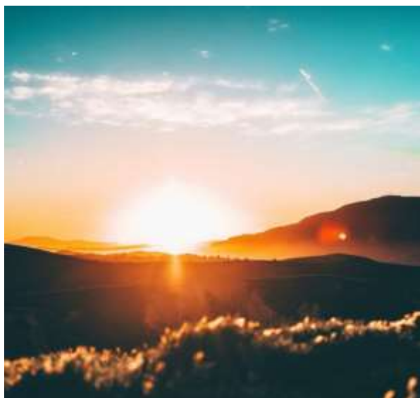
Licht voor alle volken

De strofe in vers 3 raakt een nieuw thema aan. Met een blik op de eerste dagen van de schepping, troost God zijn volk. Er klinkt een visioen van herstel, een belofte van hoop voor Jeruzalem en heel de schepping. Na zoveel uitputting, na zoveel verwoesting en het geweld, gaat God iets nieuws beginnen. Wat niet voor te stellen is, zal geschieden. De dorre vlakten zullen weer bloeien; in de steden die nu in puin liggen zal weer vreugde zijn; er zal een lofzang klinken. Het zal zijn 'zoals de tuin van Eden'. Rivieren en waterstromen zullen ontspringen uit de aarde, en bomen met allerlei zaden en vruchten zullen geplant worden. De aarde zal weer vruchtbaar zijn.