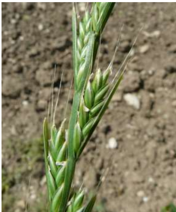
Dolle tarwe