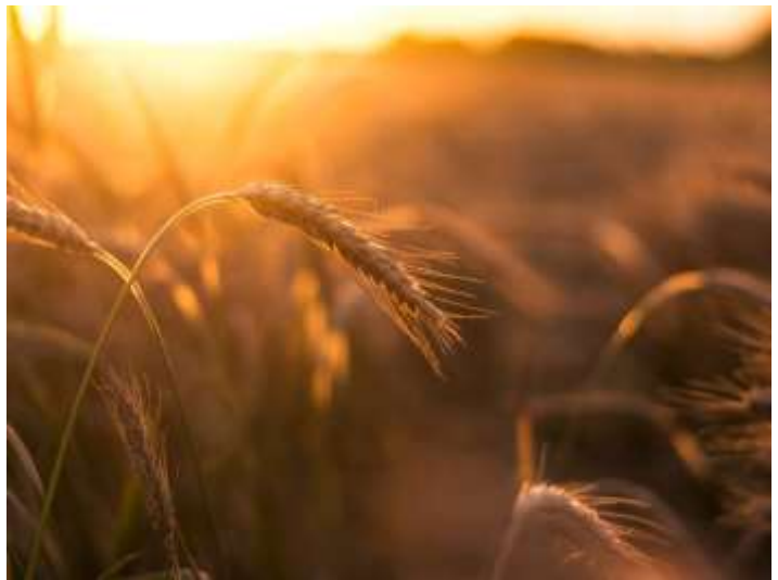
Graan wachtend op de oogst

De dienstknechten van de eigenaar vragen verwonderd hoe het kan dat de graanvelden vol staan met dolik. Heeft de Zaaier dan geen goed zaad gezaaid? Hoe kan het dat God het kwade wortel laat schieten? Het is een vraag die ook ons vaak genoeg bezig houdt: waarom laat God het kwade toe? Het antwoord dat we vinden in deze gelijkenis is eenvoudig: het onkruid komt niet van God, maar is het werk van de vijand, die in het donker – wanneer de mensen slapen – heimelijk zijn zaad uitstrooit. Want God is goed en zijn trouw duurt voor eeuwig (Ps 136:1). We voelen vaak een natuurlijke neiging om het kwaad met wortel en tak te willen uitrukken. En dat is ook precies wat de dienstknechten vragen: “wilt U dat wij er het onkruid tussen-uit wieden” (Matt 13:28)? Het antwoord van de Zaaier is duidelijk: ‘doe het niet, want je zou zomaar de goede tarwe met het onkruid kunnen uittrekken’.