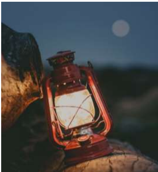
Licht in het donker