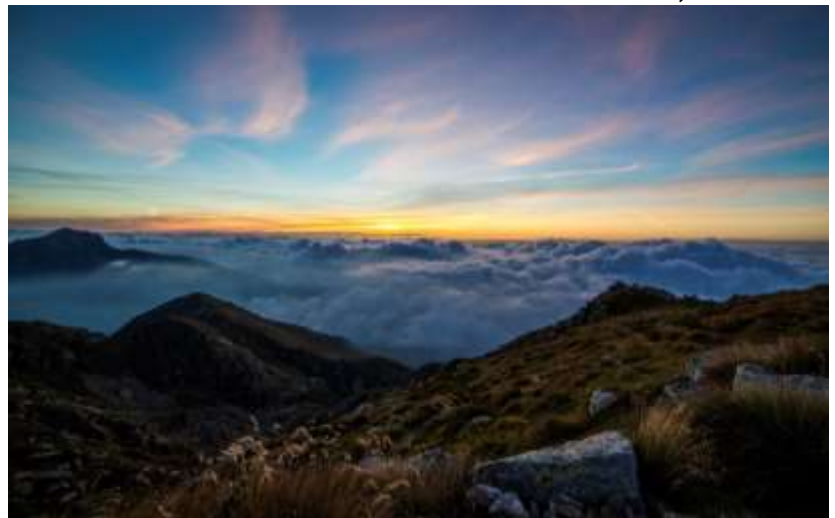
Een nieuwe weg aan de horizon

Hoe zwaar hun reis ook zal zijn en hoeveel ontberingen ze ook mogen meemaken op hun pad, toch zal er een weg zijn. Want de Heer zelf gaat hen voor, hij baant voor hen een pad. ‘De luister van de Heer zal zich openbaren’, zegt de stem in vers 5. Nu valt het Hebreeuwse woord kābôd . Dat kan niet alleen glans betekenen, maar in deze context vooral ook ‘glorie’ of ‘macht’. Het is een woord dat we kennen uit de woestijnverhalen in Exodus en Numeri, en daar mogen we het ook mee verbinden: Gods lichtend gelaat die hen omgeeft als een beschermende kracht, een wal tegen het kwaad... zo beeldend verteld in de Exodus, als de wolkkolom die hun achterhoede beschermt en de vuurkolom die voor hen uitgaat en hen richting wijst in het donker. Met diezelfde macht en bescherming gaat de Heer hen voor in deze tweede uittocht, deze reis terug naar het land van belofte.