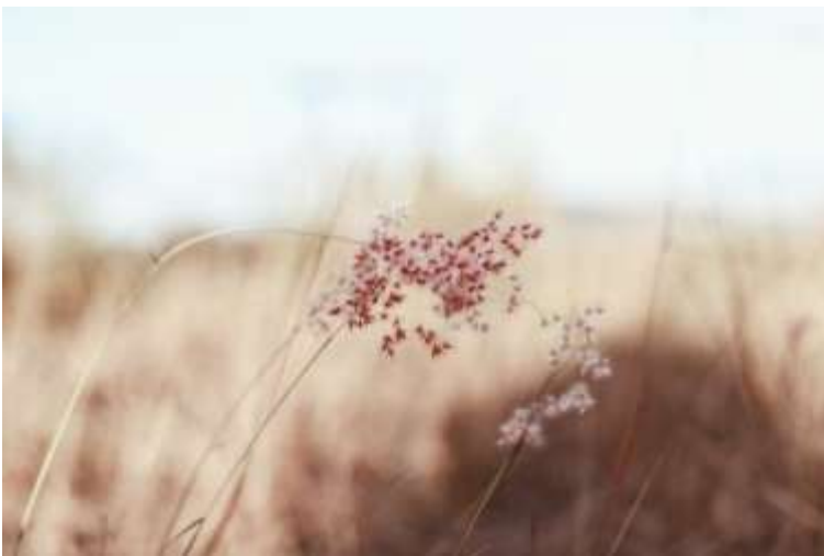
Zoals het gras dat opschiet

Verberg uw gelaat en zij bezwijken van angst, ontneem hun de adem en het is met hen gedaan, dan keren zij terug tot het stof dat zij waren. Psalm 104:29