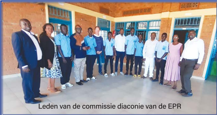
Leden van de commissie diaconie van de EPR