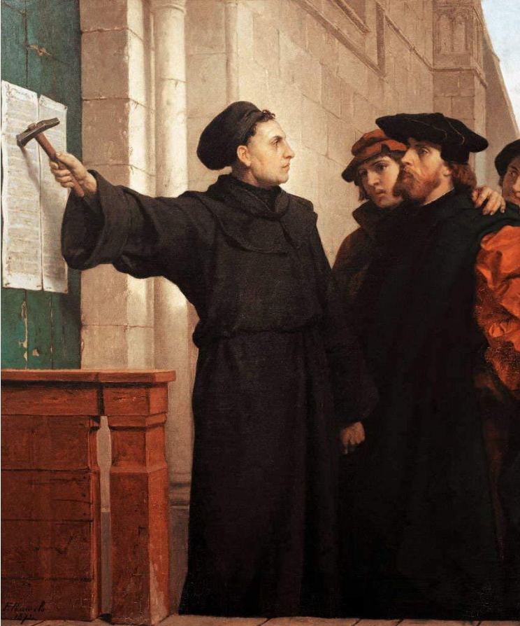
Eisenach, olieverf op doek - Ferdinand Pauwels 1872

Zondag 3 november 2024 Protestantse Kerk Brugge