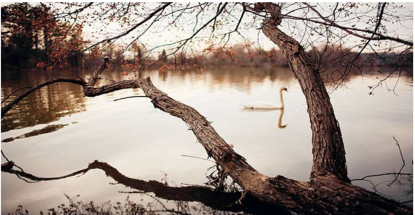
Drijven naar de overkant

Gebaseerd op de preek gehouden op Eeuwigheidszondag 25 november 2018 in t Keerske