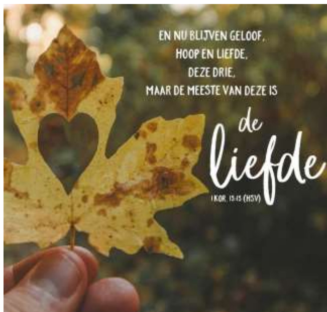
Geloof, hoop en liefde

Mozes heeft een diep persoonlijke band met God. Hun contact is intiem en vertrouwelijk. Ze spreken met elkaar als vrienden. Het spreken van aangezicht tot aangezicht gaat over een echte persoonlijke ontmoeting met God, een ontmoeting voorbij alle raad-