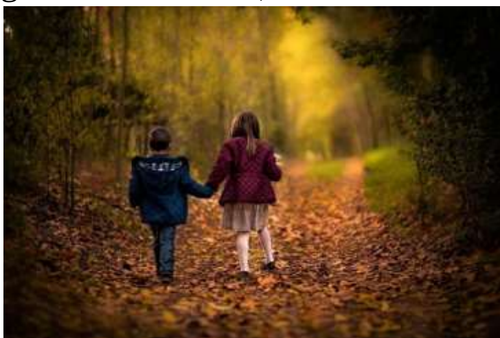
Niets is sterker dan liefde

niet, ik ware niets” (1 Kor 13:2b). Wat Paulus hier zegt kan best confronterend zijn: al geeft geloof nog zoveel houvast, al geeft dat geloof een volkomen zekerheid en vertrouwen; al verzet je er bergen mee... als het niet uit liefde is, wat is het dan waard? Zoals waarheid niet zonder liefde kan, zo kan ook het geloof niet losge-