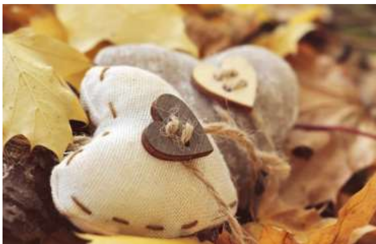
Liefde in de herfst

Tegenover alle discussies, tegenover elk onvertogen woord en alle onbegrip, zet Paulus slechts één woord: de agapé , de liefde. Alles verbleekt in het licht van de liefde. Er zit een prachtige opbouw in dit tekstgedeelte. In de verzen 1-3 komt Paulus met een redenering waarmee hij zijn