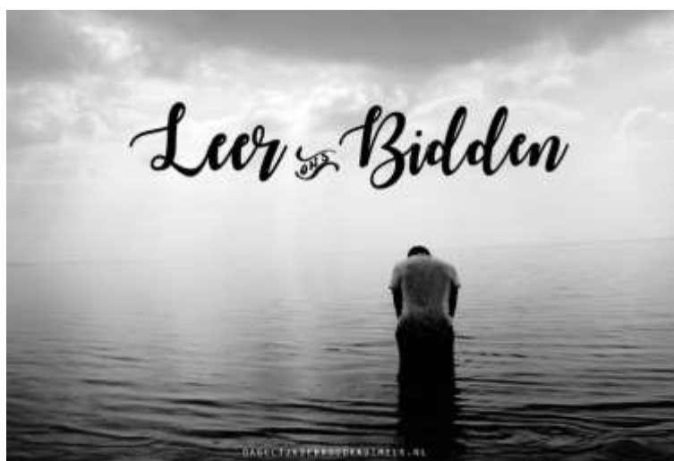
Bevrijding ligt verborgen in het buigen voor God

De genezing loopt anders dan Naäman had gehoopt en dat maakt hem boos. Woest is hij, verbolgen, over het feit dat Elisa niet eens naar buiten komt om hem – de grote Naäman – te begroeten. Hij moet het doen met een dienaar van Elisa, die hem vertelt dat hij moet afdalen in de Jordaan. Zevenmaal moet hij zich onderdompelen in het water. Naäman is pisnijdig. De Jordaan was tijdens droge periodes, niet meer dan een vies, modderig stroompje. Als je je dan