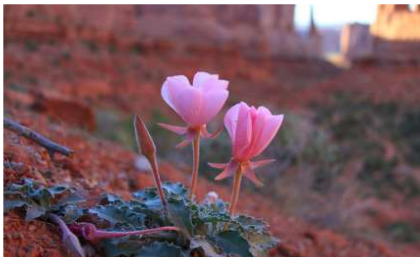
Bloemen in de woestijn

Het lied van Jeremia eindigt prachtig. Juichend komen ze eraan. Opnieuw schrijft Jeremia over meisjes die dansen in de rei (Jer 31:13). Maar nu dansen ook jongens en grijsaards mee. Mannen en vrouwen, jong en oud: iedereen doet mee. ‘Hun rouw verander ik in vreugde’, zingt Jeremia. ‘Ik troost hen; hun verdriet vergeten zij’. God buigt alles om. Zoals de steppe die in bloei staat, de woestijn die in het voorjaar weer volstroomt met leven omdat het