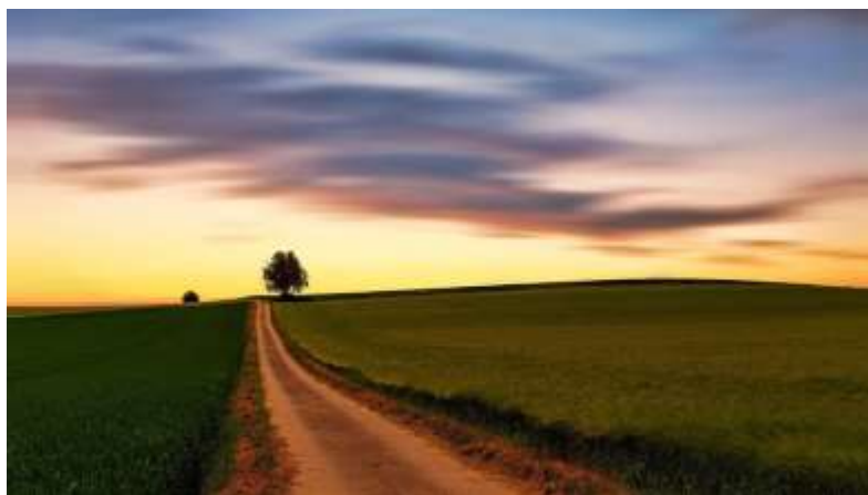
Een weg ten leven

Nu de vreugde hersteld is, en ogen en oren van mensen ontsloten zijn, wordt de weg zichtbaar die zij moeten gaan. De weg die God hen toont is bovendien een begaanbare weg. Jesaja noemt die weg ook wel dereḳ haqqōdeš : een heilige