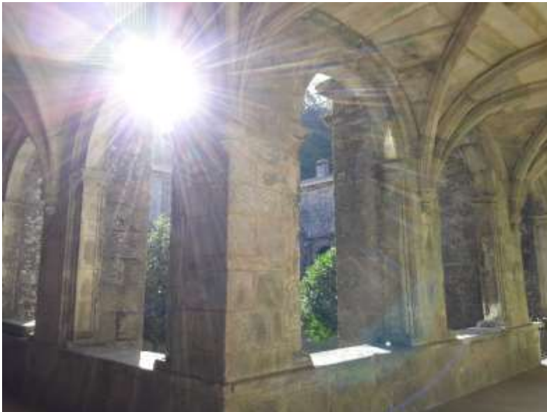
Zonsopkomst, foto gemaakt tijdens de Camino-tocht van mijn moeder, oktober 2018

mens mag zich te goed doen, en verzadigd worden ( Heb. śāba = verzadigen), van de goedheid waarmee hij ons hart wil door-stromen. Het is voor de dichter ontzag-wekkend, hoe God recht doet en genadig aanwezig is (Ps 65:6).