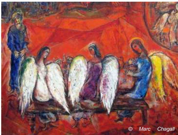
Marc Chagall, Abraham et le trois anges. Saint-Paul-de-venge, France, 1966.

Wat vooral opvalt aan Abraham is zijn actieve houding. De gasten komen niet naar hem toe. Hij beweegt zich naar hen toe. Wanneer Abraham hen ziet, stapt hij uit zijn comfortzone, zijn tent uit, naar de mannen die daar staan, "even verderop" (Gen 18:2). Het verhaal van Abraham verbeeldt ook heel mooi hoe praktisch gastvrijheid is. De reizigers krijgen een plek in de schaduw; handen en voeten worden gewassen, en een royale maaltijd wordt bereid. Abraham maakt zich er niet gemakkelijk van af. De gasten krijgen