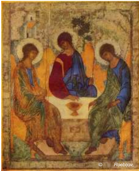
Roerbljov's Icoon van de Drie-vuldigheid, 1410, Tretjakov

Ook Paulus beschouwt de gastvrijheid als een belangrijke christelijke waarde, en maant in zijn befaamde Romeinenbrief aan om steeds gastvrij te zijn (Rom 12:13). Een mooi voorbeeld van een doorleefde christelijke spiritualiteit, die gastvrijheid verheven heeft tot kernwaarde van het christen-zijn, zien we terug bij de Benedictijnen. Benedictus van Nursia zag gastvrijheid als een kans om God te ontmoeten. Door letterlijk ruimte te scheppen voor de naaste, en in het bijzonder voor de vreemdeling, ontstaat er ruimte om de ultieme Ander te ontmoeten. Want in het 53 e hoofdstuk van de regel van Benedictus, lezen we dat een gastvrije kerk, een kerk is waar gasten als Christus zelf worden ontvangen (RB 53: 1-2, 6-7a). 3