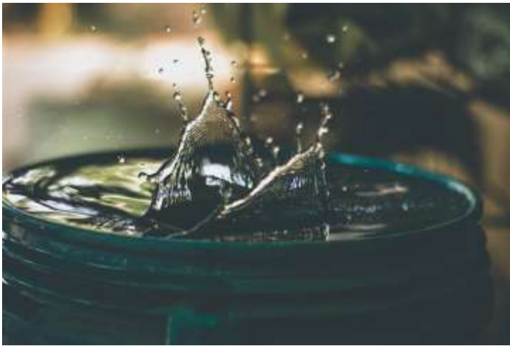
Drink uit de bron

De gemeente van Efeze was heel divers. In deze Griekse havenstad waren zowel Joden als mensen met een Grieks-Romeinse achtergrond tot geloof gekomen. In de gemeente van Efeze was er dus een hele groep mensen die kortgeleden nog een heel ander leven hadden gekend, waar vluchtigheid, losbandigheid en andere vormen van dwaas gedrag er gewoonweg bij hoorden. In de verzen 17-24 spreekt Paulus in het bijzonder deze groep aan. In zijn woorden klinkt een ernstige waarschuwing door: blijf op de weg die je bent ingeslagen; verval niet in de vluchtigheid van je oude leven; doe niet mee met wat de heidenen doen zodat je vreemd raakt van God. En verlies jezelf niet in alle verleidingen die de wereld biedt. Dat zijn tijdloze, wijze woorden.