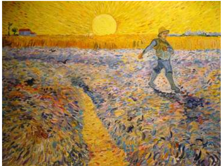
De Zaaier, 1888 (Kröller-Müller, Otterlo).

Een belangrijk element in de parabel van de zaaier, is de zaaier zelf. 'De Zaaier' is misschien wel één van de mooiste schilderijen van Vincent van Gogh. Tegen de achtergrond een goudgeel veld van tarwehalmen, en een stralende zon die de akker met haar stralen verwarmt, is de zaaier aan het werk. De zaaier heeft iets onvoorwaardelijks.