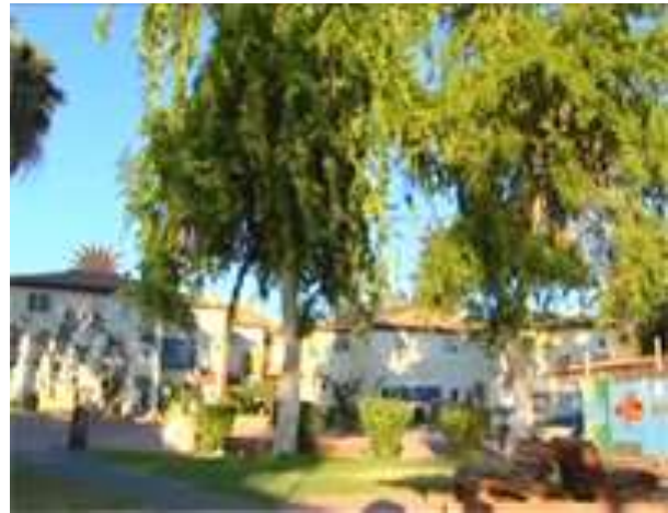
Het kindertehuis "Neve Hanna"