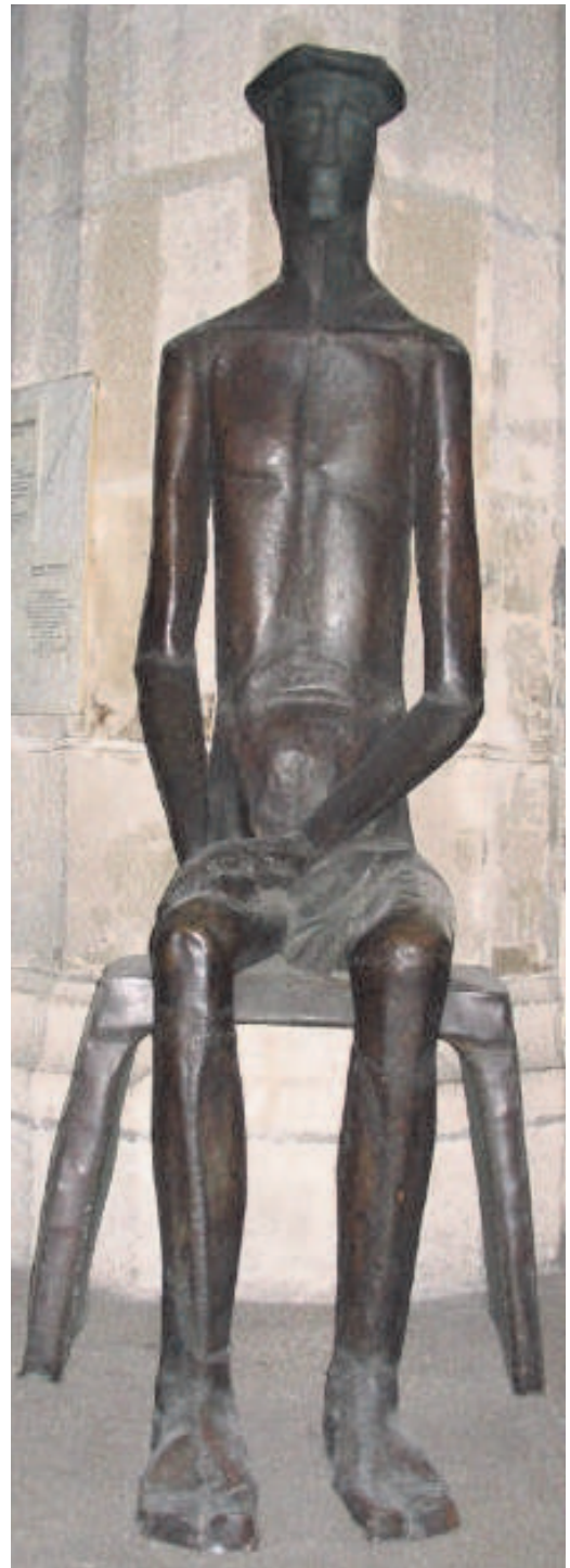
Ecce Homo, St. Merri, Parijs